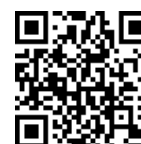
Imagen interesante Pozos de gravedad https://xkcd.com/681/

En general la gravitación enlaza con astronomía y astrofísica, donde la cantidad de temas es muy grande: energía oscura, Big Bang, radiación de fondo, expansión del universo, exoplanetas, ... se tratan en el bloque de cosmología.